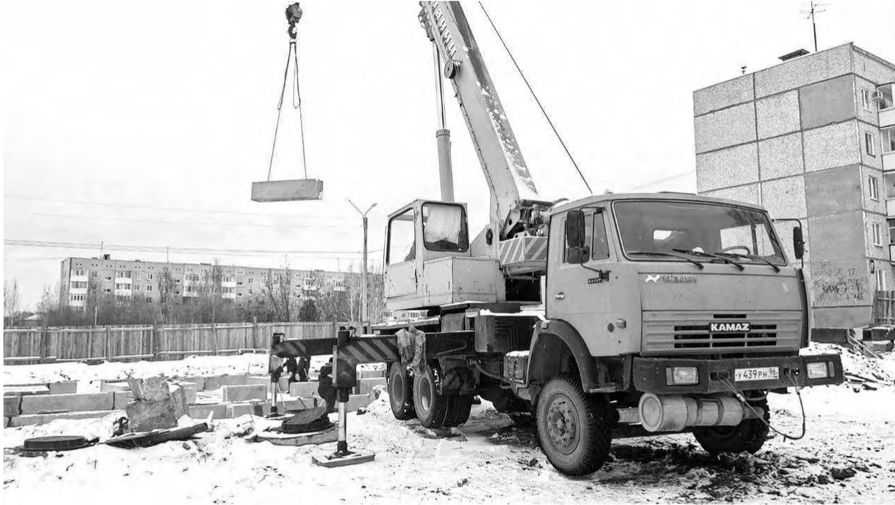
Стройка на Жукова, 17 – подрядчик готовит площадку под фундамент

Аварийный жилфонд ликвидируют, бюджетникам дадут квартиры