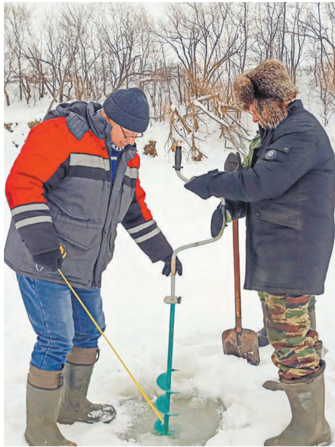
Лед на Нице бурили в нескольких местах и делали замеры