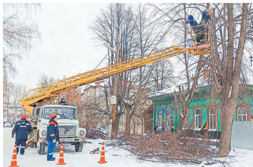
Для обрезки деревьев коммунальщики используют спецтехнику