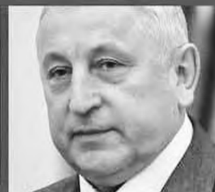
НИКОЛАЙ ХАРИТОНОВ - КПРФ