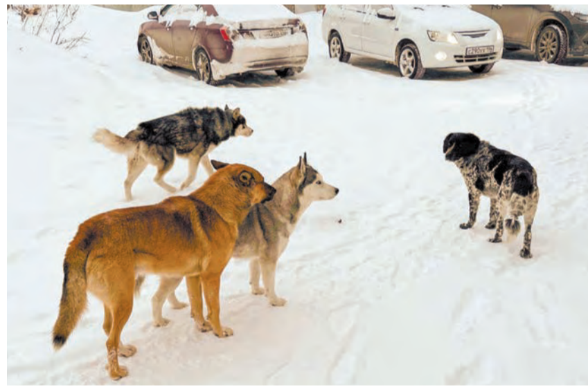
Вот такую собачью стаю увидели журналисты «Восхода» на одной из городских улиц

В новогодние праздники ирбитчане в соцсетях пожаловались на большие собачьи стаи у Центра детского творчества «Кристалл». А девятого января у детской поликлиники собака напала на ребенка (хорошо, что рядом проходил мужчина и отогнал ее). Кто занимается отловом безнадзорных животных и куда ирбитчане могут сообщить о проблеме, выяснил «Восход».