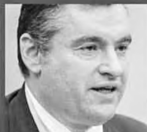
ЛЕОНИД СЛУЦКИЙ - ЛДПР