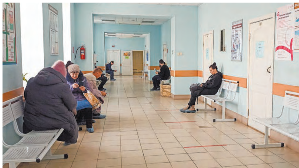
С электронной медкартой пациентам не придется тратить время на ожидания у кабинетов

– В настоящее время идет дубляж информации, то есть она есть и на бумажном носителе, и в электронном виде. Персонал загружен этой работой, поэтому сейчас мы проводим регулярные мероприятия по обучению процессу цифровизации, чтобы максимально быстро перейти