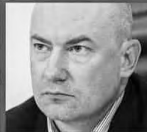
СЕРГЕЙ МАЛИНКОВИЧ - КОММУНИСТЫ РОССИИ