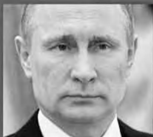
ВЛАДИМИР ПУТИН - САМОВЫДВИЖЕНОЦ