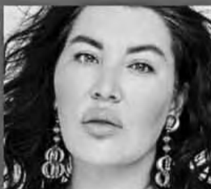
РАДА РУССКИХ - САМОВЫДВИЖЕНОЦ