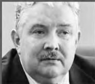
СЕРГЕЙ БАБУРИН - РОССИЙСКИЙ ОБЩЕНАРОДНЫЙ СОЮЗ