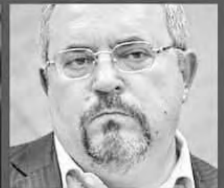
БОРИС НАДЕЖДИН - ГРАЖДАНСКАЯ ИНИЦИАТИВА