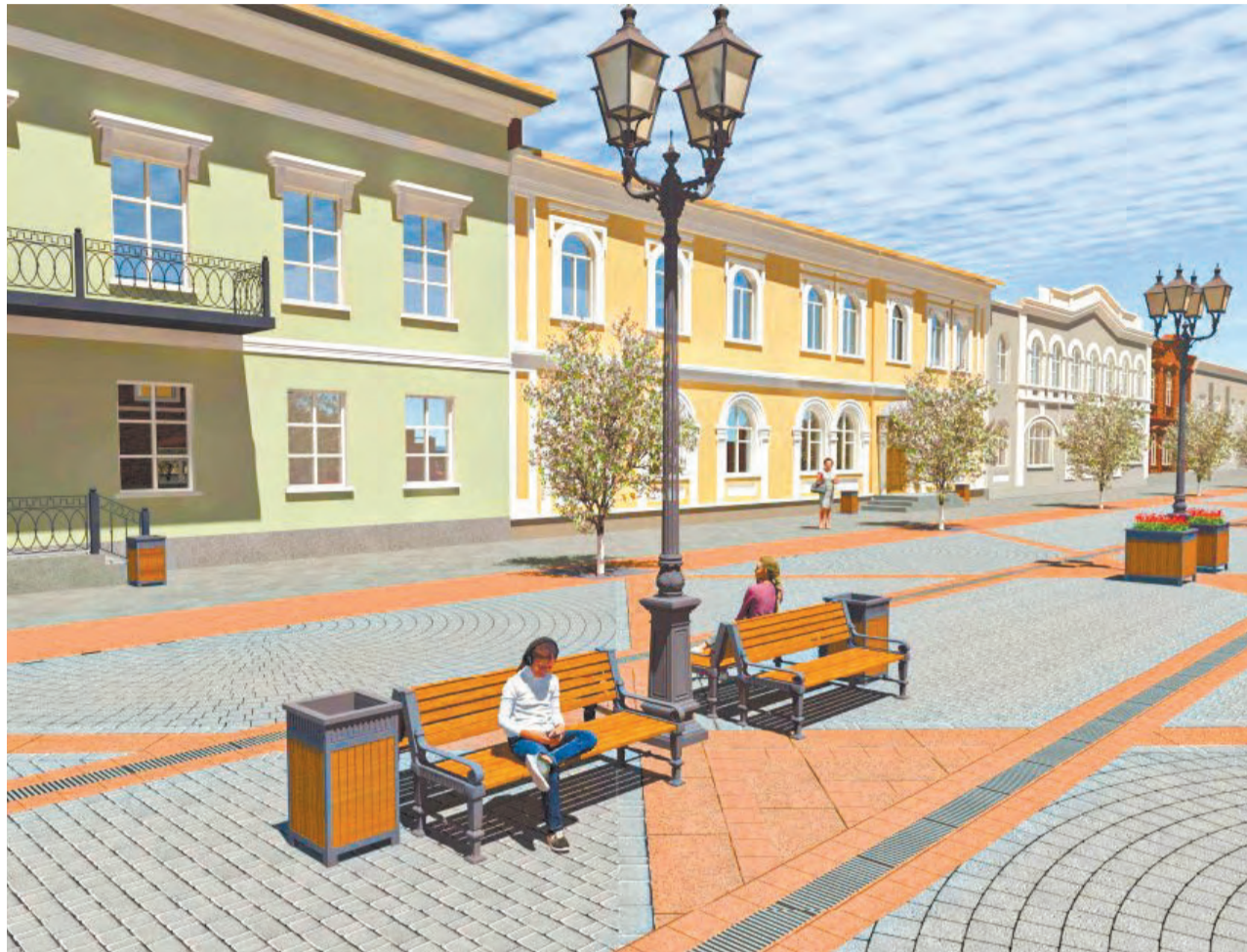
Так после благоустройства будет выглядеть улица Красноармейская

В администрации Ирбита назвали общественные территории, которые будут благоустроены в ближайшее время