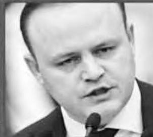
ВЛАДИСЛАВ ДАВАНКОВ - НОВЫЕ ЛЮДИ