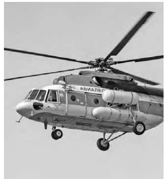
Авиасохрана с высоты видит очаги торфяных пожаров, когда они выходят на поверхность земли.

Уникальную технологию зимнего тушения торфяных пожаров разработали на Урале. Тлеющие участки находят с помощью самолетов и беспилотников, оборудованных широкоугольными камерами и тепловизорами. Приборы помогают определить границы скрытых под снегом пожаров — на экране они светятся яркими пятнами.