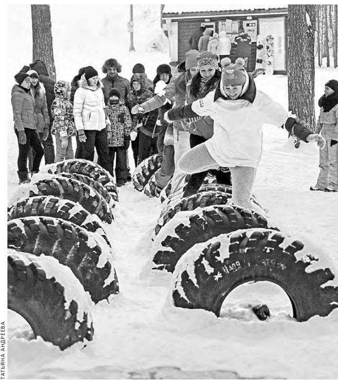
Тем, кто не побоялся в холодную погоду выбраться из дома, владельцы загородных баз и клубов предложили развлечения для любого возраста.

отелей и хостелов — составила 85 процентов. Наиболее популярными оказались гостиницы 2-3 звезды. Был шанс превзойти показатели 2023 года, но вмешались экстремальные морозы. Многие в такую погоду искали развлечения в помещениях: более 270 тысяч человек отметились в музеях и театрах. В числе самых популярных — «Эрмитаж-Урал», Музей истории Екатеринбурга и Свердловский областной краеведческий музей. Более 2000 человек поднялись по ступеням Невьянской башни. Не обошли вниманием туристы и крупнейший музейный комплекс в Верхней Пышме. Осмотр экспозиции военной и гражданской техники многие сочетали с поездкой на ретропоезде и посещением станции Шувакиш: все билеты на «Уральский экспресс» были раскуплены заранее.