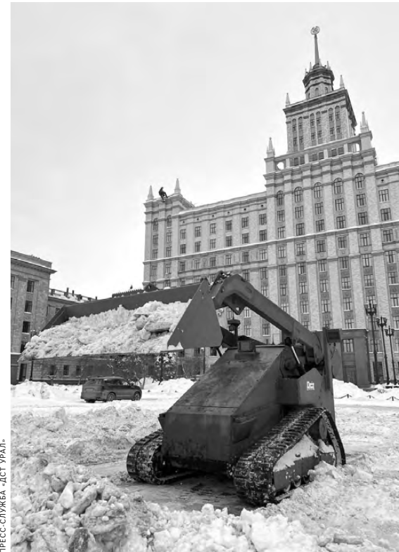
Компактная и маневренная машина может выполнять сложные задачи в ограниченном пространстве.