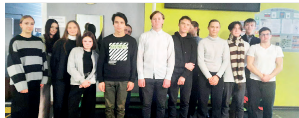
Выпускники школы № 16 первыми приступили к сдаче нормативов. А ты сдал нормативы ГТО?!