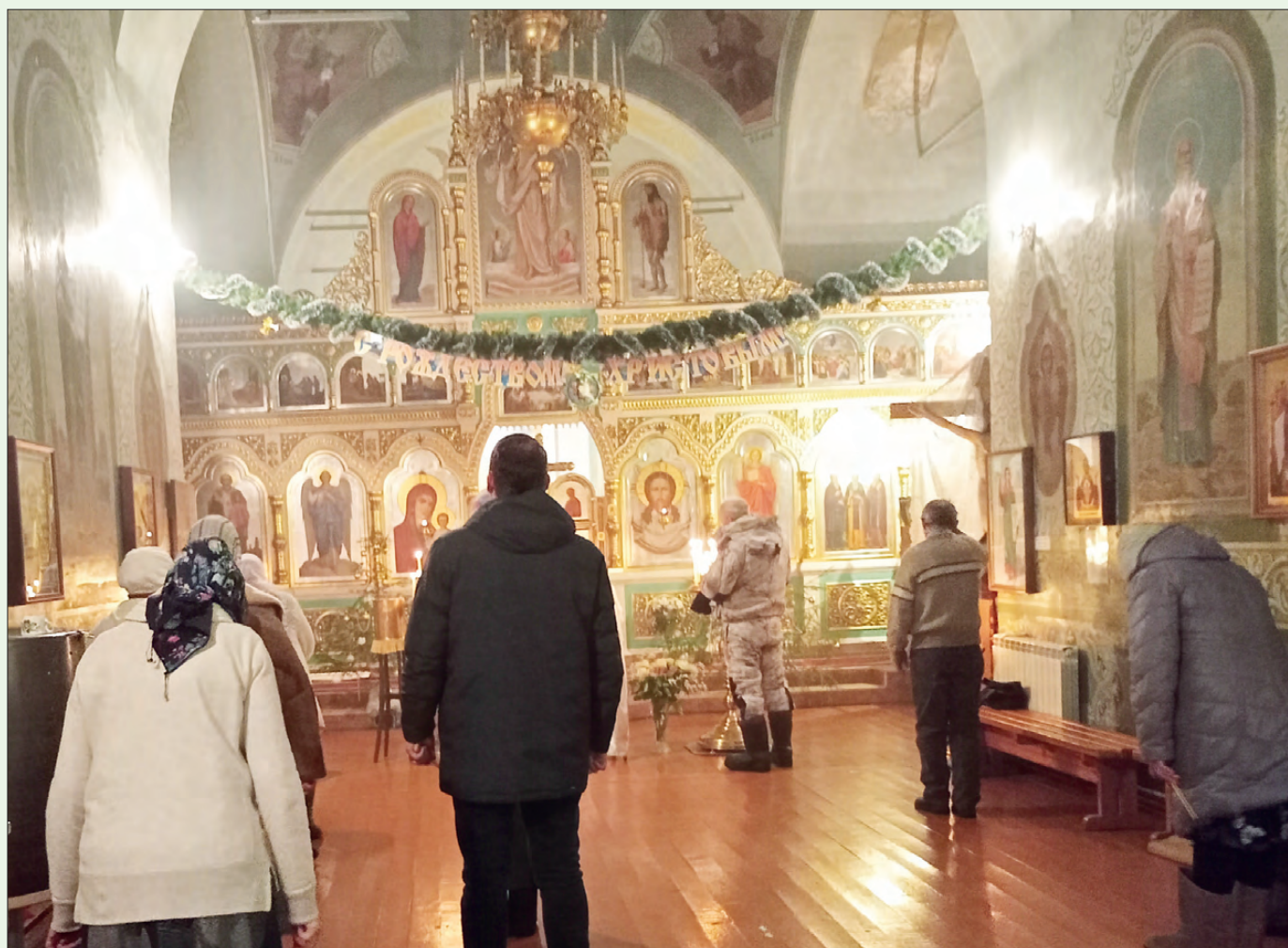
Праздничная служба в храме с.Кунгурка.

№2 (75910), СРЕДА, 17 января 2024 года • Дегтярская общественно-политическая газета • наш сайт: zabol-deg.ru • 16+