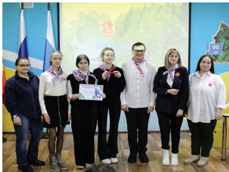
Награждение команды школы № 8

Участие в игре приняли команды активистов первичных отделений «Движения Первых» из школ № 1, 6, 8 и ДЮЦ «Ровесник». В процессе мероприятия подросткам предлагались различные задания. Ребята отвечали на вопросы об исторических событиях, географических объектах, флоре и фауне родного