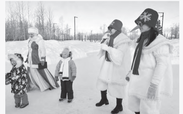
Игровая программа «Старый Новый год» в «Парке искусств»

Кстати, все благоустроенные территории активно используются для проведения городских спортивных и культурно-массовых мероприятий.