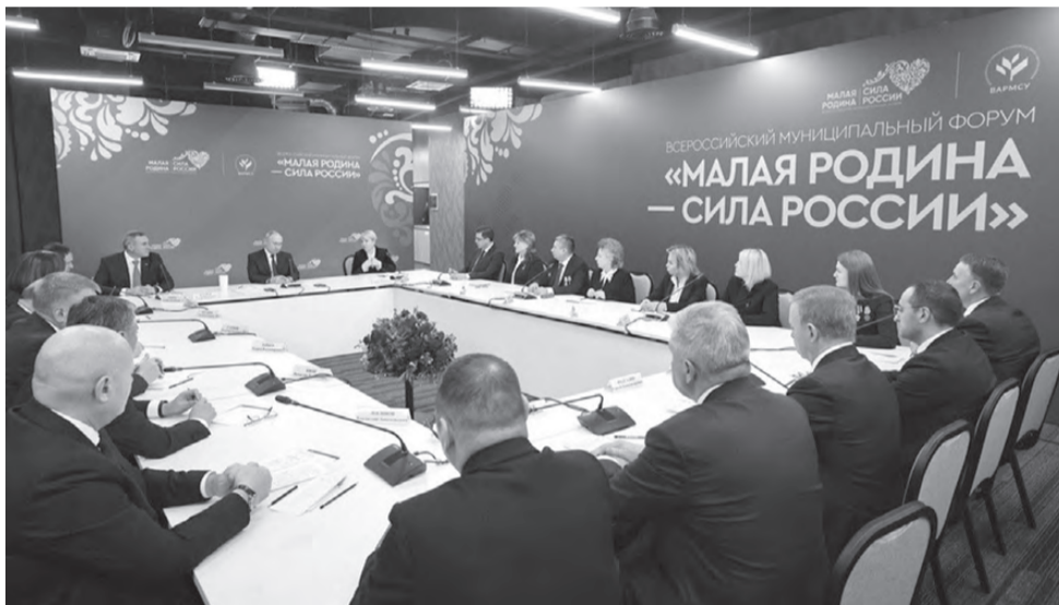
Встреча В. Путина с главами муниципальных образований

чилось то, о чем я вас просил, а именно: я просил вас включить в этот процесс людей. 14,2 миллиона человек приняли участие в этой совместной работе, – прокомментировал Владимир Путин, обращаясь к представителям муниципалитетов.