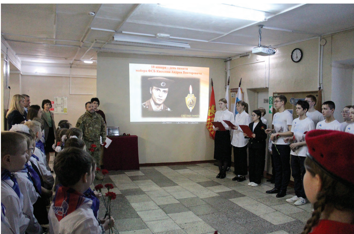
Торжественная линейка, посвященная памяти А.В. Киселева