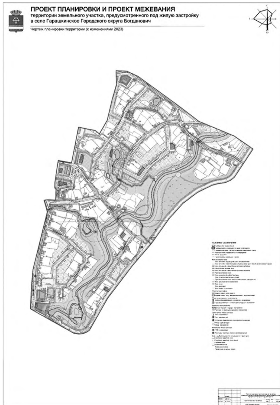
Приложение № 4 к постановлению главы городского округа Богданович от 28.12.2023 № 2252