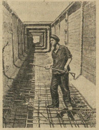
Сталинская область. Строители канала Северный Донец — Донбасс решили закончить все работы на трассе на год раньше срока — к 41-й годовщине Великого Октября.

На ускорение оборачиваемости форм и стендов, а следовательно, и на увеличение выпуска изделий оказало влияние также внедрение в качестве арматуры проволоки периодического профиля. Применение этой проволоки обеспечило надежное сцепление арматуры с бетоном низких марок.