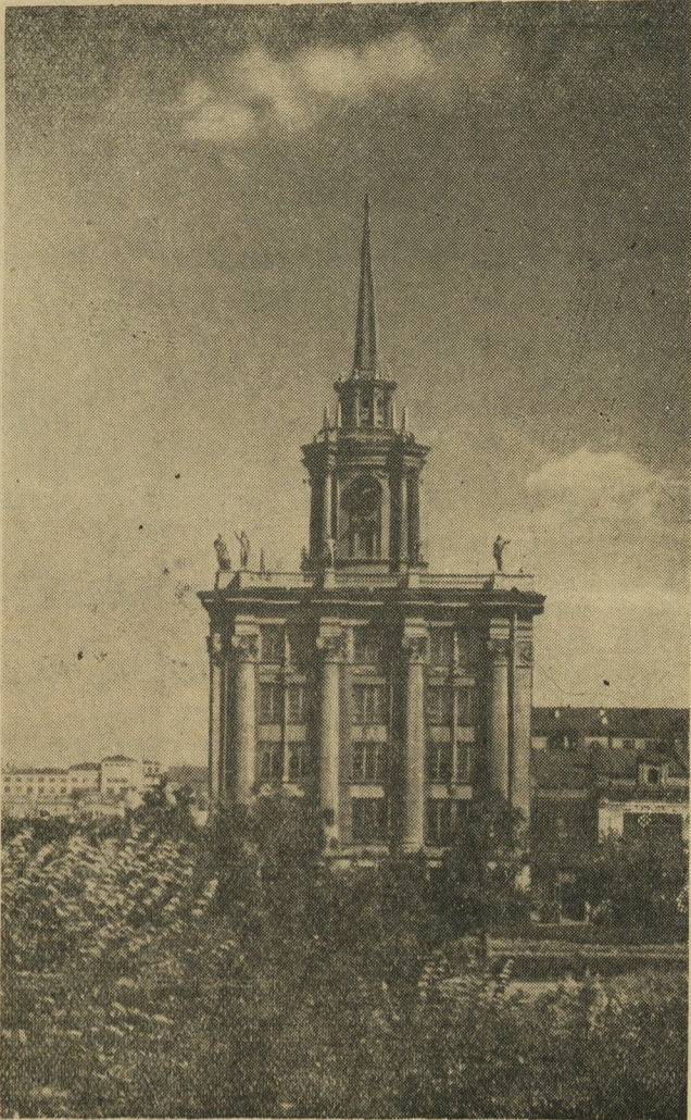
ЗДАНИЕ СВЕРДЛОВСКОГО ГОРСОВЕТА (Вид с улицы Вайнера)