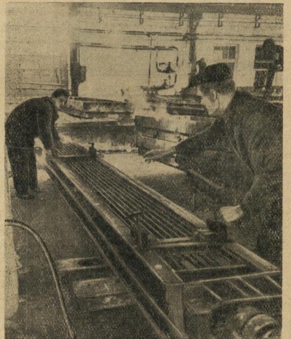
Подготовка напряженной арматуры к бетонированию в цехе бетоноарматурного завода № 1.

Пробная панель была испытана под нагрузкой и выдержала две тонны