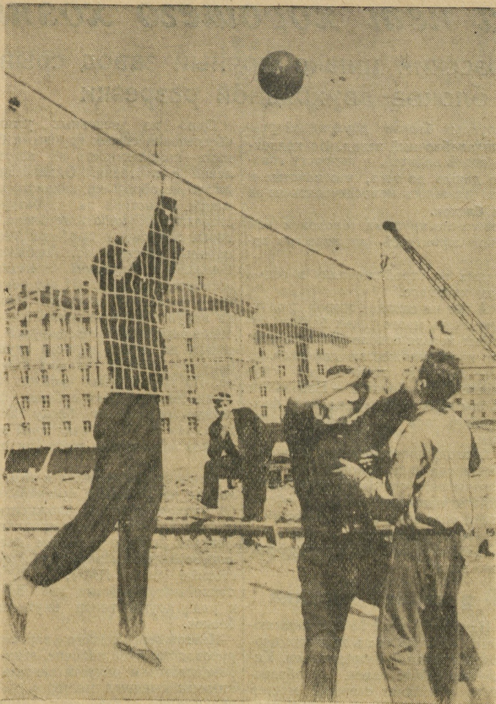
Товарищеская встреча по волейболу между командами общежитий по улице Генеральской и ул. Ирбитской.