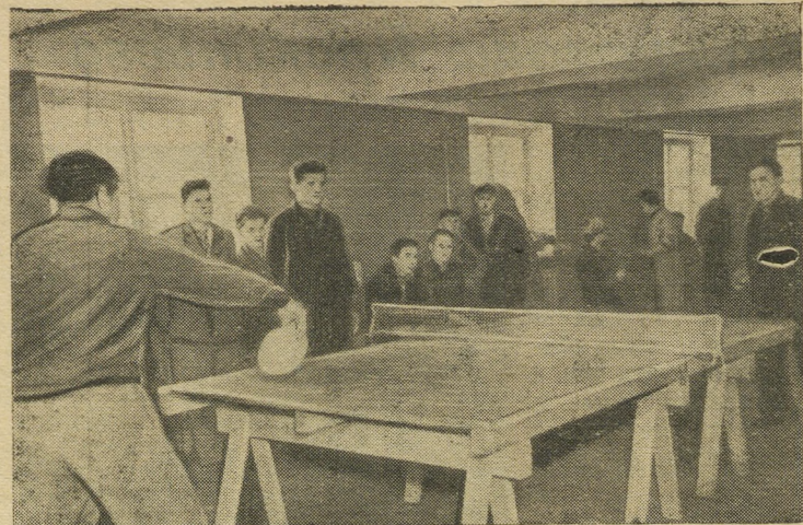
Недавно в стройтресте № 89 проведены соревнования по настольному теннису, новому для физкультурников треста виду спорта. Кроме строителей, в них участвовали команды комбината производственных предприятий и строительного училища.

В предвыборные дни этот коллектив дал 15 концертов на нескольких избирательных участках, составив их из лучших номеров своей программы.