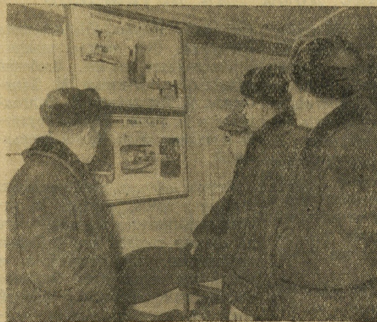
На снимках (слева): вот они — крупные блоки Сугресского завода; справа — участники конференции осматривают фототрифины выставки.

На конференции была организована выставка новых изделий, выпускаемых предприятиями и крупных блоков четырех- и двухрядной разрезки, пустотных фундаментных блоков, опор для уличных фонарей, деталей забора.