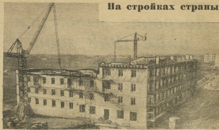
На стройках страны

Во Фрунзенском районе Ташкента развернулось жилищное строительство. В ближайшие годы здесь будет возведено более 400 многоквартирных домов, в которых поселится около ста тысяч человек. На снимке: общий вид строительства жилых зданий во Фрунзенском районе города.