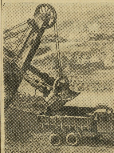
Хорошо трудятся горняки Дашкесанского рудоуправления Азербайджанской ССР. В прошлом году они завоевали переходящее Красное знамя Совета Министров СССР и ВЦСПС. На снимке: разработка руды на северо-восточном руднике.

А. БАРЕШКО, председатель постройкома стройуправления № 774.