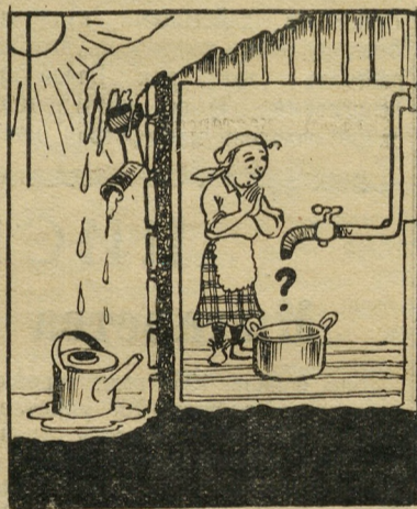
— Дождусь — не дождусь...

Квартиры в доме № 48 по улице Энтузиастов, где живут строители треста № 89, считаются благоустроенными, соответственно с жильцов берется и квартирная плата.