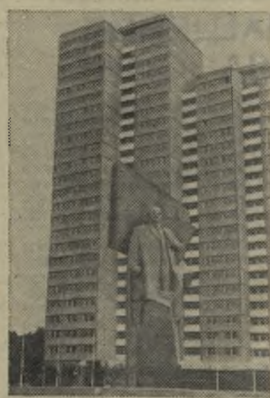
ГДР. Памятник В. И. Ленину в Берлине на новой площади, которая носит имя вождя международного пролетариата.