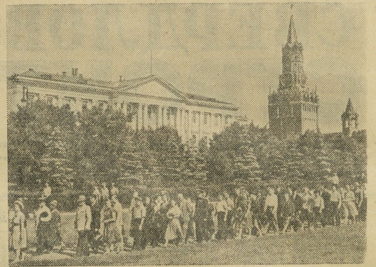
Близится всенародный праздник — сороковая годовщина Великой Октябрьской социалистической революции. Все больше и больше экскурсантов стремится познакомиться с историческими местами, связанными с периодом становления Советской власти.