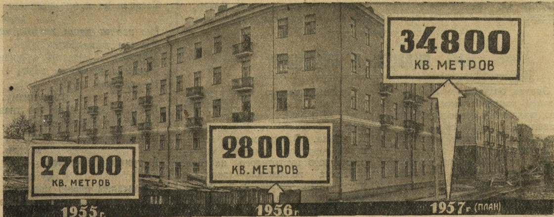
РОСТ ВВОДА В СТРОЙ ЖИЛОЙ ПЛОЩАДИ В СРАВНЕНИИ С ПОСЛЕДНИМ ГОДОМ ПЯТОЙ ПЯТИЛЕТКИ.