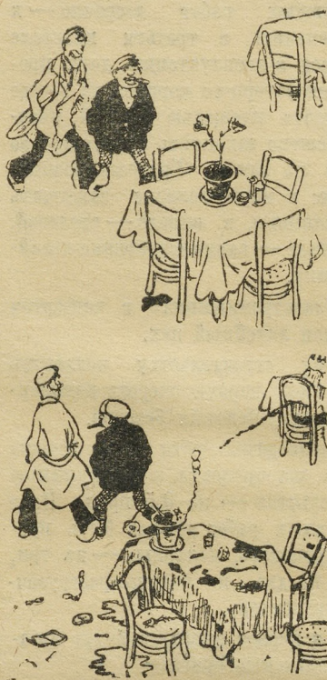
— Приятно пообедать в культурной, чистой столовой... И пообедали...