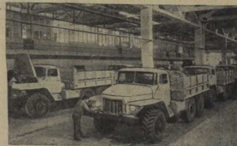
У СОЗДАТЕЛЕЙ «УРАЛОВ»

Для детей в городе будет организовано катание на лошадях.