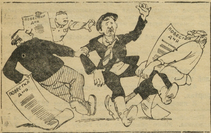
Много еще у нас проводится различных совещаний и заседаний.

Коллектив базы настаивает, чтобы новый состав постройкома потребовал строительства помещения для машинопрокатной базы.