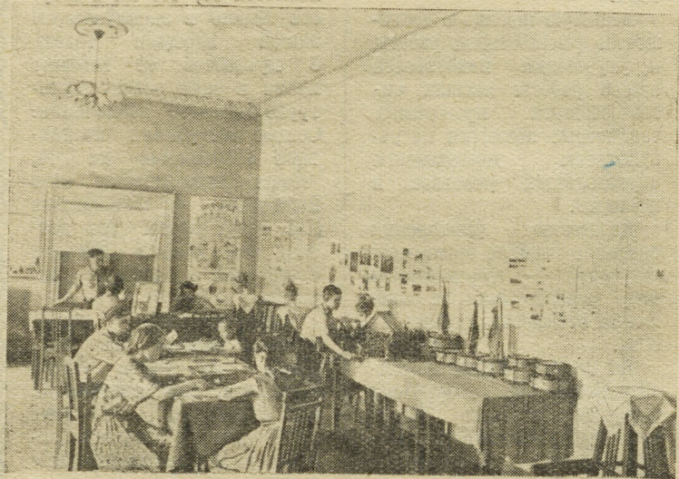
В пионерской комнате лагеря.

первое звено третьего отряда. Понравился пионерам и карнавал, игра на местности «Будь готов!», костер, посвященный дружбе и товариществу. Пионер-