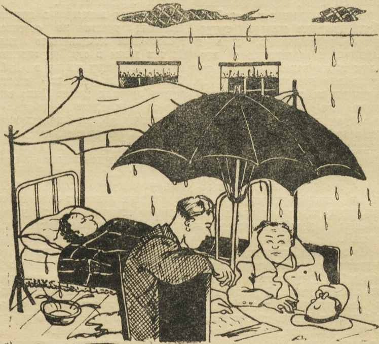
— На улице дождь перестал, а у нас еще продолжается...