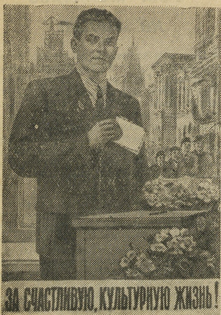
ЗА СЧАСТЛИВУЮ, КУЛЬТУРНУЮ ЖИЗНЬ!