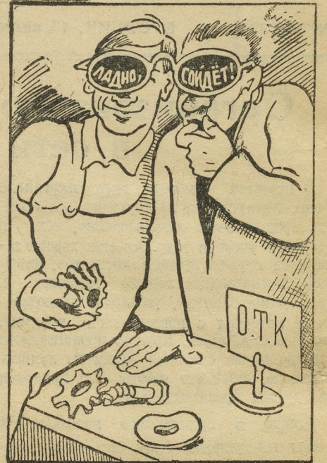
Бракодел и браковщик иногда видят одинаково. Рис. А. Зубова.

На ремонтно-механическом заводе не борются за улучшение качества продукции, контроль за качеством изделий осуществляется плохо. Предприятия треста по своим заказам часто получают от РМЗ недоброкачественную продукцию. (Из заявления строителей).