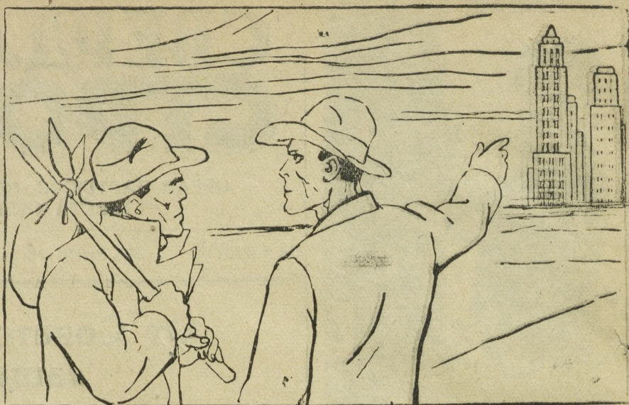
Рис. В. Лыскова.