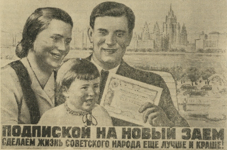
Плакат работы художника В. Корецкого (Госфиниздат).

Все невыигравшие облигации, начиная с 1955 года, погашаются по их нарицательной стоимости. Для этого, кроме тиражей выигрышей, будут производиться тиражи погашения.