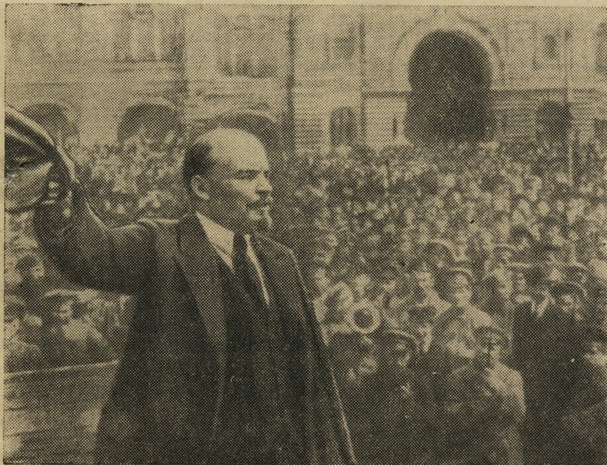
В. И. Ленин в Москве на Красной площади. Май 1919 г.