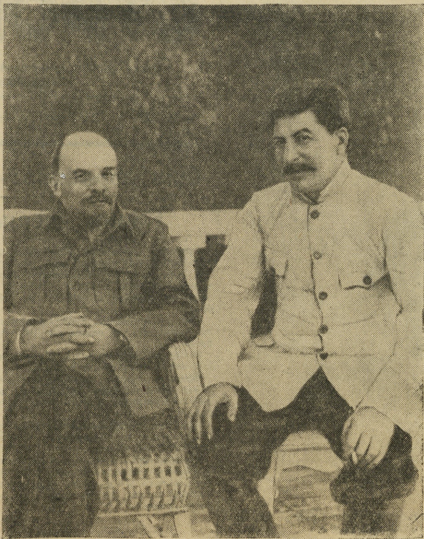
В. И. Ленин и И. В. Сталин в Горках. 1922 год

(Из материалов отдела пропаганды и агитации ЦК ВКП(б) и Института Маркса—Энгельса—Ленина при ЦК ВКП(б).