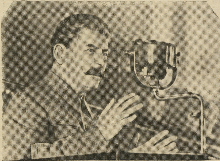
И. В. Сталин делает доклад о проекте Конституции СССР на Чрезвычайном VIII Всесоюзном съезде Советов (1936 г.).

Иначе обстоит дело в капиталистических странах. Там свирепствует безработица и нищета. Даже в самой богатой из капиталистических стран — Соединенных Штатах Америки — число безработных достигло колоссальной цифры. «По официальным данным, число полностью безработных в Соединенных Штатах Америки за последний год удвоилось, а вместе с полубезработными, работающими неполную неделю, состав-