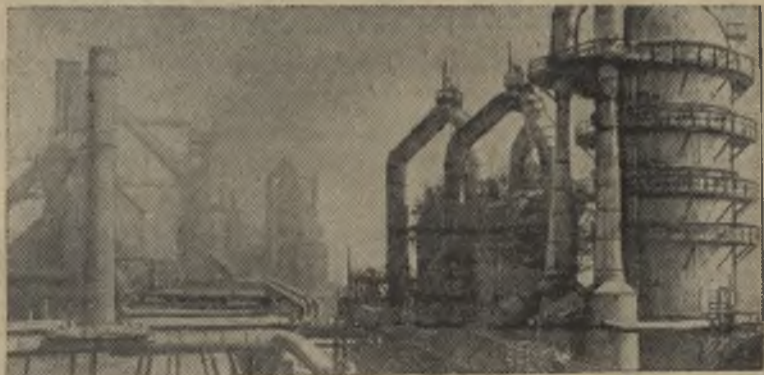
Вологодская область. Больших трудовых успехов добились доменщики Череповецкого металлургического завода. Они завершили выполнение социалистических обязательств по выпуску сверхпланового чугуна, принятых на пятилетку. За четыре с половиной года страна получила от них