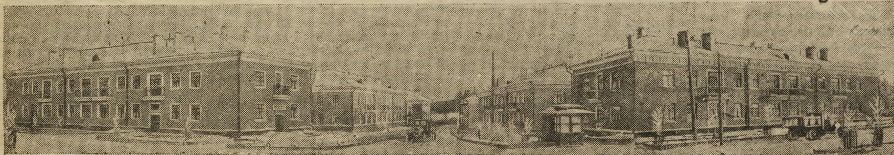
На снимке: кварталы жилых домов, построенные коллективом Свердловскпромстроя для трудящихся Куйбышевского района в 1948 году.