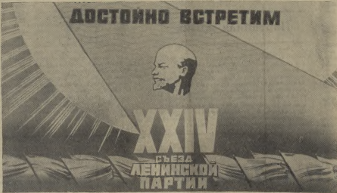
Достоинно встретим XXIV съезд Ленинской партии. Плакат художника В. Викторова (издательство «Изобразительное искусство»).