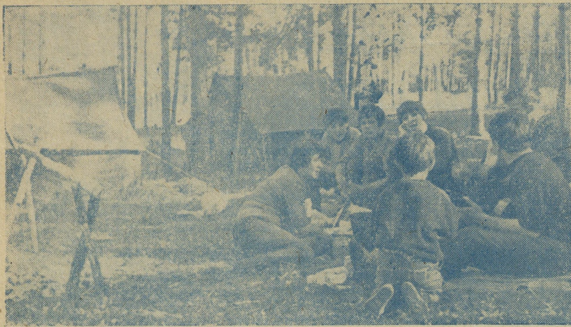
Пока уха не закипела, лется по лесу напев «Уральской рябинушки».

Типография издательства «Уральский рабочий», Свердловск, пр. Ленина, 49.