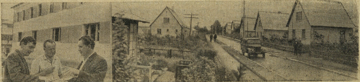
ТЕРНОПОЛЬСКАЯ ОБЛАСТЬ. Колхоз «Радянська Украина» — одно из передовых хозяйств Подволочисского района. Достаток пришел и в каждую семью. В селе построены сотни новых индивидуальных домов с электричеством, газом и ванными. Один за другим сдаются в эксплуатацию и новые многоквартирные дома для колхозников.