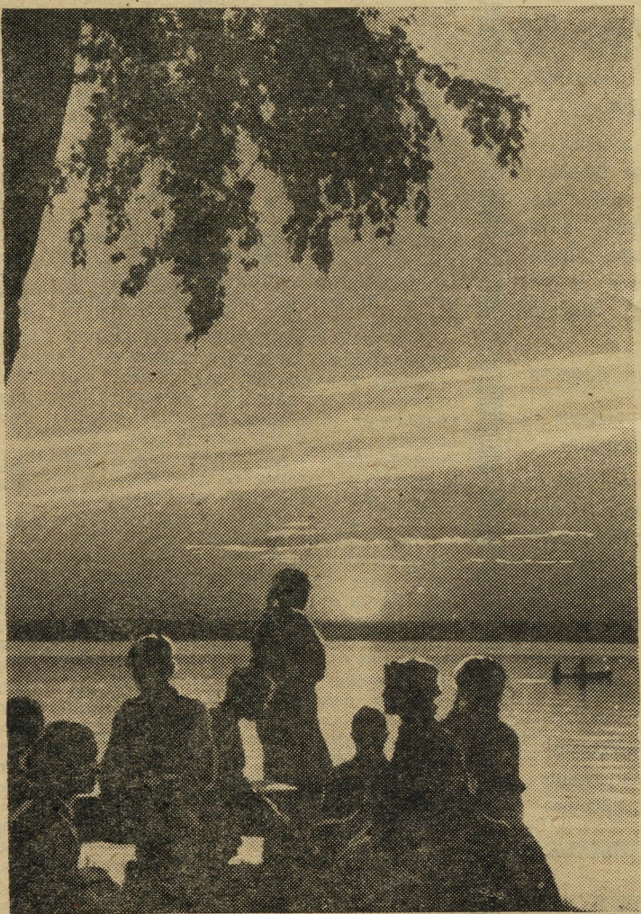
ВЕЧЕРОМ НА ОЗЕРЕ ШАРТАШ.