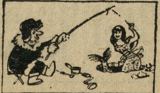
— Хотите — верьте, хотите — нет!