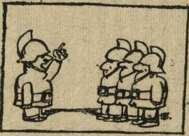
— Сегодня у нас горячий денек, у кухонных плит хлопочут мужчины.