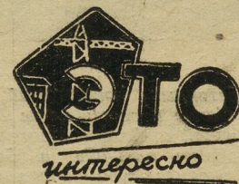
Фото автора. Рисунки В. Иванова.

В середине следующего дня поезд Прага — Москва доставил нас на пограничную станцию Чоп. Вот мы и снова на родной земле. У каждого — масса впечатлений от этой интересной поездки.