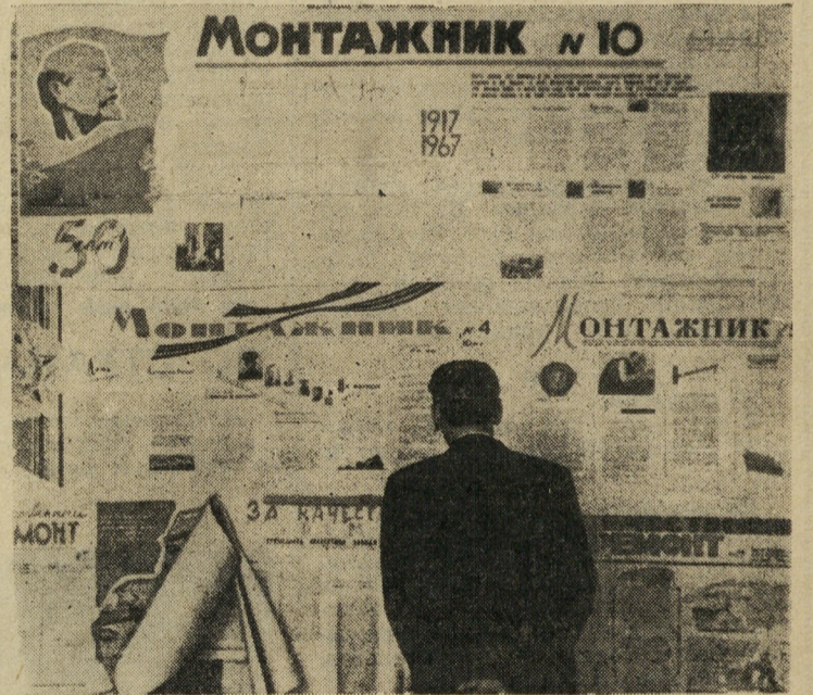
Несколько дней в фойе Дворца культуры имени М. Горького висели стенные газеты...

По итогам смотра-конкурса ПЕРВОЕ МЕСТО с вручением переходящего кубка, Почетной грамоты решено присудить редколлегии ежедневной стенной газеты 23 управления треста Уралмашстрой «За Темпы». Редколлегия награждена бесплатной туристической путевкой по Советскому Союзу и путевкой на ВДНХ.