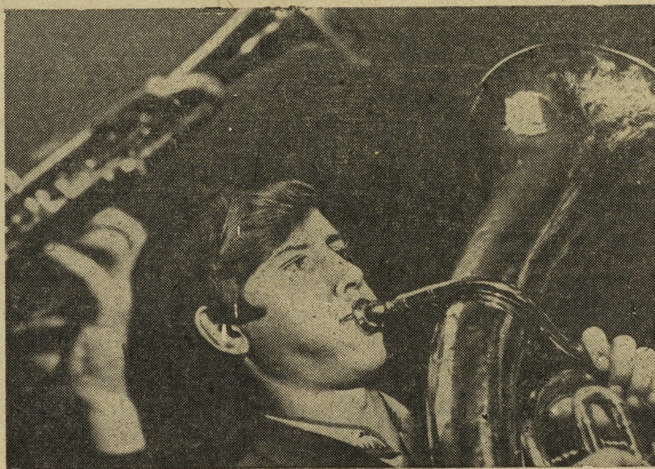
Никогда не пустует красный уголок общежития по проспекту Космонавтов, 52б.