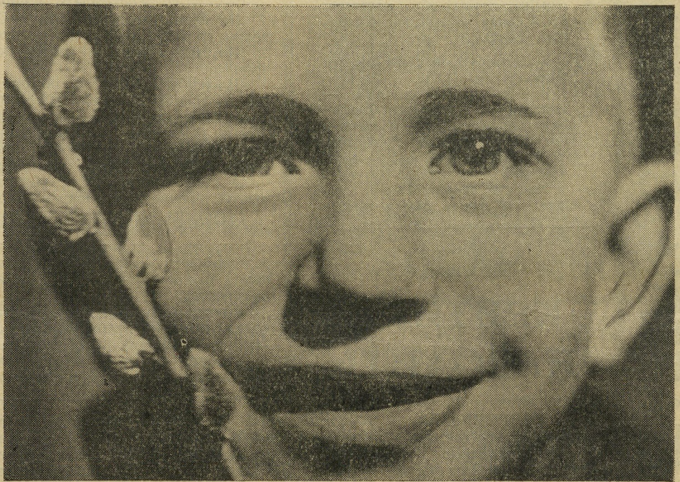
Моя шестая весна...

Е. ГОРШЕЧНИКОВ, каменщик восьмого управления.