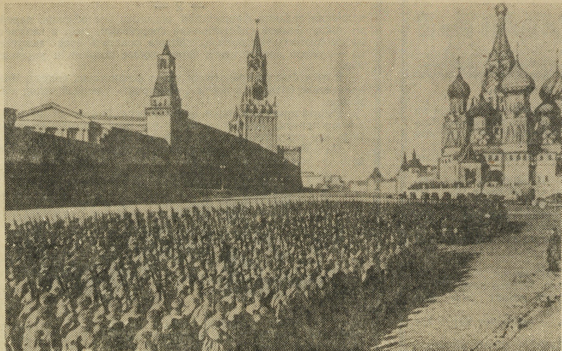
Защитники столицы направляются на фронт.