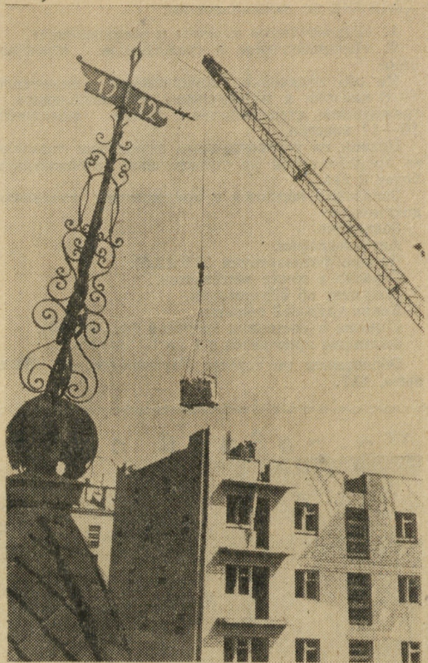
Черты нового и старого.