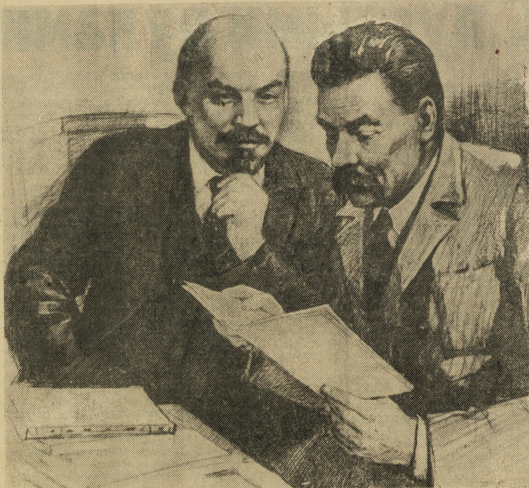
В. И. Ленин и А. М. Горький.