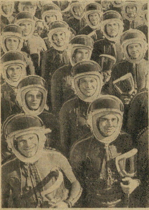
У каждого из них свой характер, свой воздушный «почерк».

230 Героев Советского Союза, в том числе такие прославленные летчики, как Полина Осипенко, Георгий Байдуков, Александр Беляев, Александр Покрышкин, Борис Сафонов, Амет Хан-Султан, космонавт Валерий Быковский, вышли из стен училища.