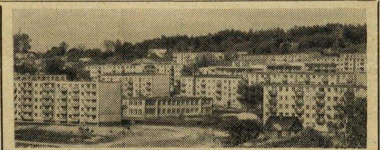
ВИЛЬНЮС. 21 июля исполняется 25 лет Советской Литве. За эти годы выросла и изменилась столица республики. Построен ряд новых предприятий, культурных учреждений, учебных заведений, выстроены новые жилые районы.

На снимке: новый жилой массив Антакалис, построенный на месте прежних пустырей на берегу реки Нерис.