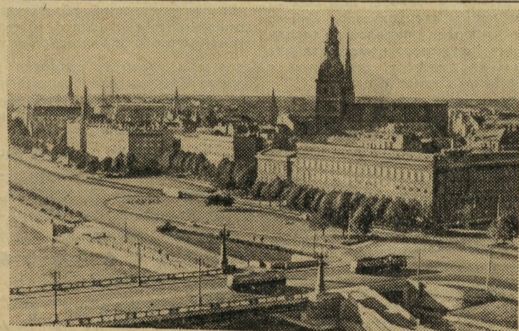
Рига. Вид на Комсомольскую набережную.

В столице Литвы Вильнюсе всегда полно гостей из братских республик, а также из зарубежных стран. Они будут довольны новой гостиницей «Гинтарас», построенной у привокзальной площади.