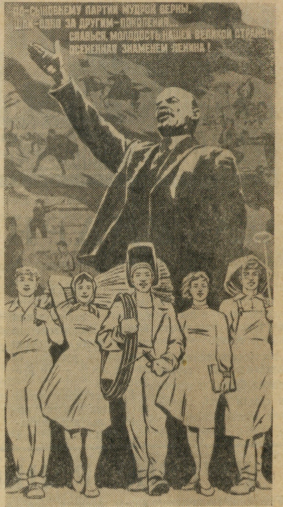
По-сыновнему партии мудрой верны, Шли — одно за другим — поколения... Славься, молодость нашей великой страны, Осененная знаменем Ленина! Плакат художника В. Нарышкина. Стихи А. Филатова.

— Мы — молодые. Нам доверено великое дело — строить коммунизм. И мы гордимся этим и с честью продолжим то, что начали наши деды, отцы и матери.