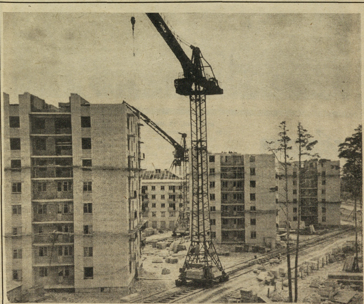
На улице Блюхера поднимаются этажи первых высотных домов.