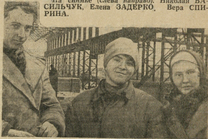
Начальник штаба стройки о них сказал: — Споровистые. Умелые.

Систематическая и целенаправленная массовая работа в борьбе за повышение культуры производства и улучшение качества приносит свои плоды. Общественным инспекторам все меньше и меньше приходится делать замечания нерадивым. Их количество уменьшается, а число помощников у общественных инспекторов возрастает.