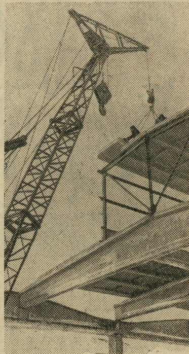
На заснеженном берегу Оби, где сооружается Барнаулский резиново-асбестовый комбинат, появилась еще одна строительная площадка. Скоро на ней вырастут корпуса цехов завода асбестовых и технических изделий.