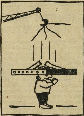
Изошутка Ю. ИВАНОВА,