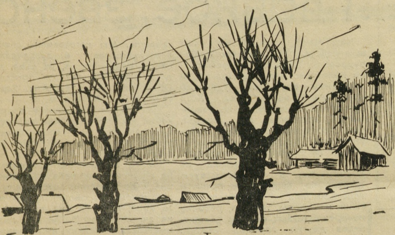
Рисунок Е. Грудцинова, шофера управления механизации № 1.