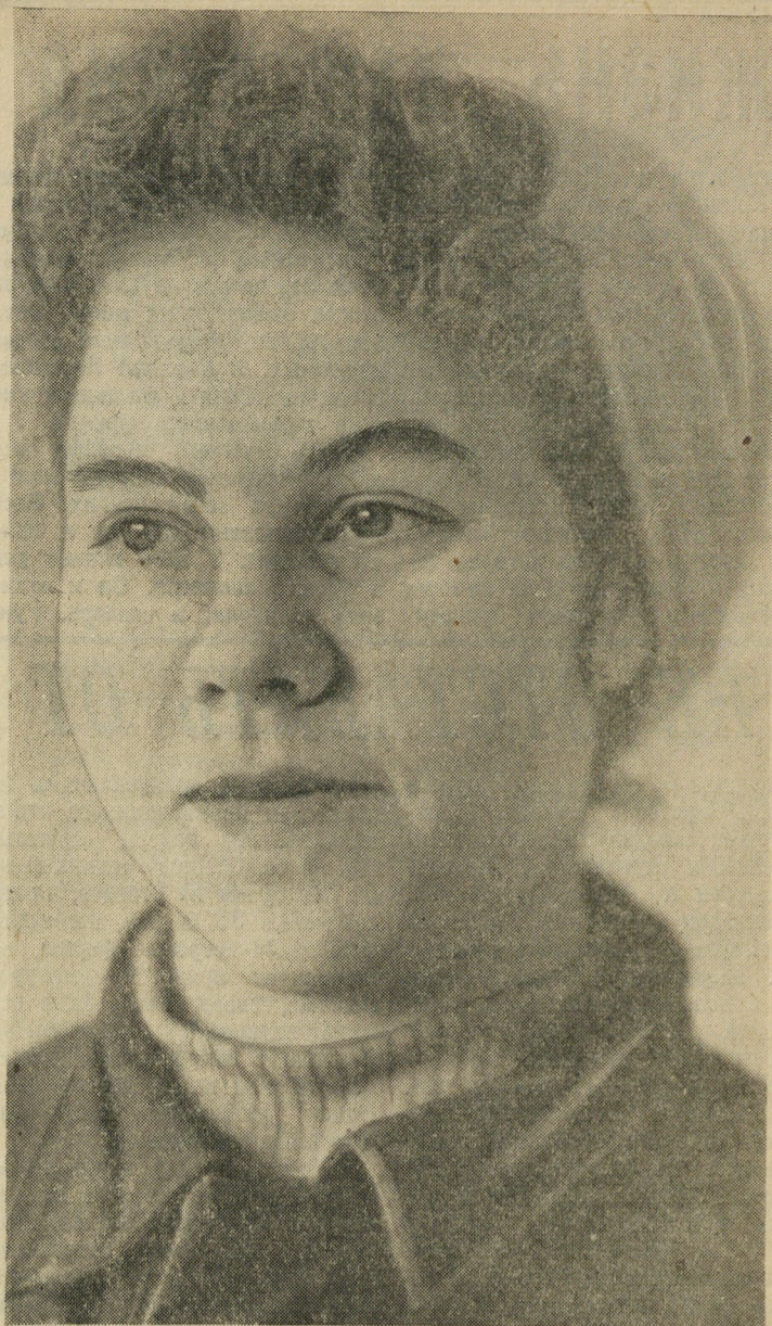
Перед праздником Октября бригада штукатуров девятого управления К. Долгорукова закончила работу на доме завода Уралэлектротяжмаш имени В. И. Ленина и перешла на следующий — дом жилищного кооператива по улице Красных Борцов.

Ю. МОРОЗОВ, председатель объединенного профкомитета треста Стройдеталь № 70.